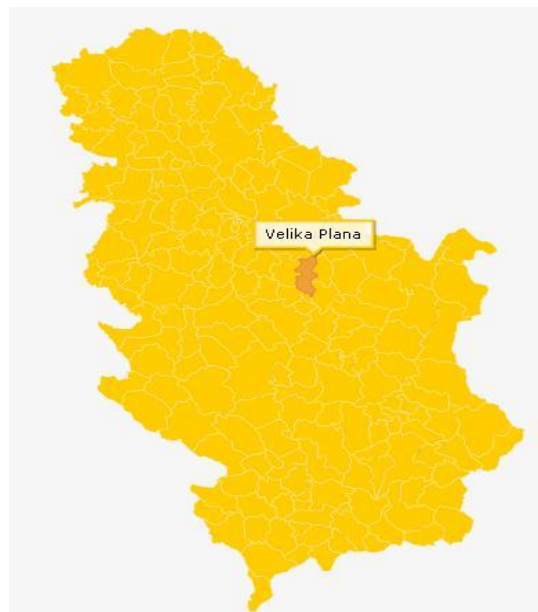
Слика 1: Велика Плана географски положај